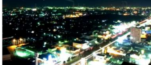
鹿島セントラルホテル スカイラウンジプラネットからの眺望

↓↓↓ 詳細・お申し込み方法は裏面をご覧ください ↓↓↓ ※写真はすべてイメージです