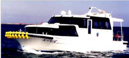
遊覧船ユーリカ号 運航会社:鹿島埠頭株式会社

※当日の天候、気象条件により、遊覧船の運航を中止することがあります。その際は、陸側から工場夜景をご案内いたします。